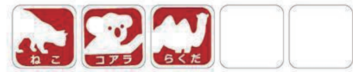
スタンプ押し見本